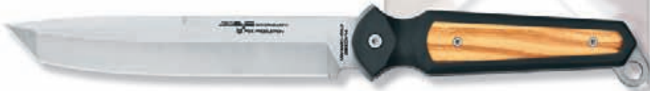
465 olivo - olive wood peso 250 gr - weight 8.8 oz

Blade: 440C stainless steel HRC 57-59 Handle: CNC machined T6-6061 aircraft aluminium hard coated