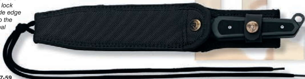
fodero - chiusura brevettata sheath - patented locking system