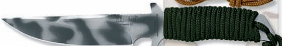
1666S peso 160 gr - weight 5.6 oz