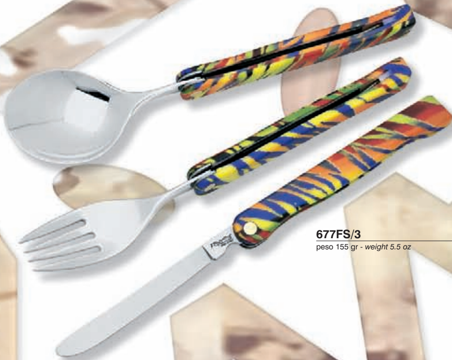
677FS/3 peso 155 gr - weight 5.5 oz

Manico: Polypropilene PP-EP + Sublimazione