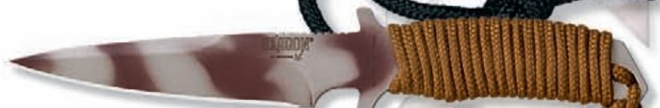
1665S peso 150 gr - weight 5.3 oz