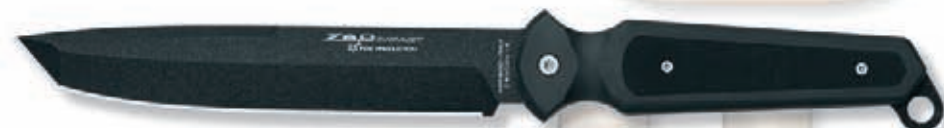
467 G10 peso 250 gr - weight 8.8 oz