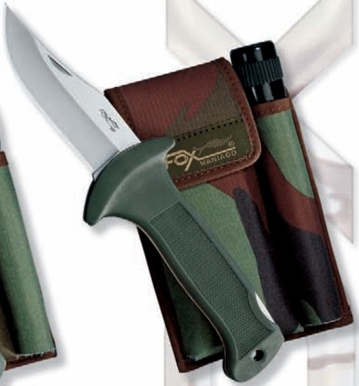
1577 peso 340 gr - weight 12.0 oz