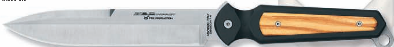
464 olivo - olive wood peso 250 gr - weight 8.8 oz