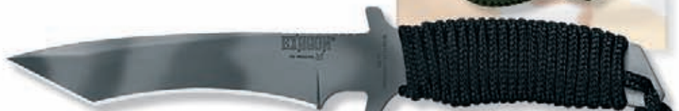
1667S peso 155 gr - weight 5.5 oz