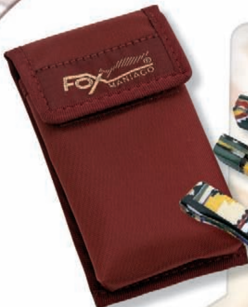
677FS/6 peso 155 gr - weight 5.5 oz