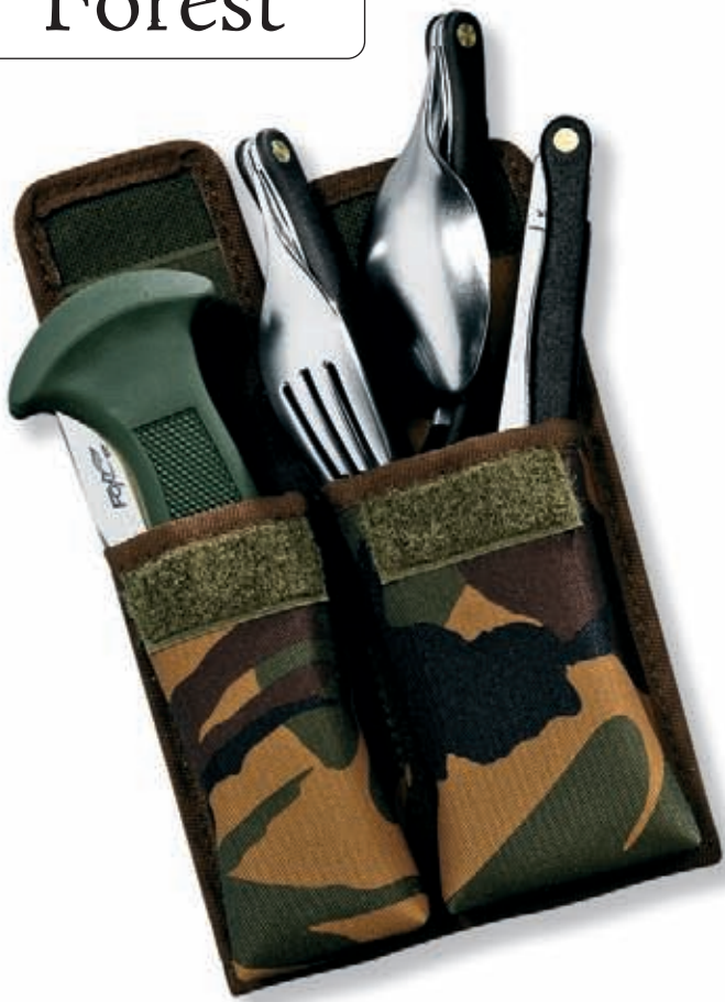
1677 peso 355 gr - weight 12.5 oz