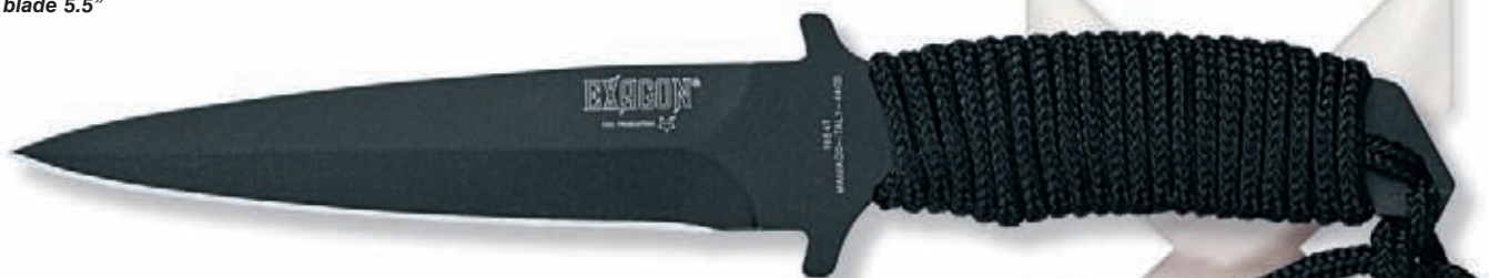
1664T peso 150 gr - weight 5.3 oz

Blade: 440B stainless steel HRC 56-58 Handle: Parachute-rope