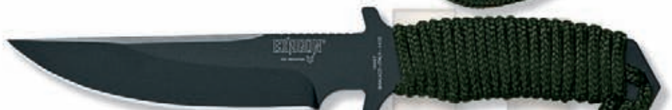
1666T peso 160 gr - weight 5.6 oz