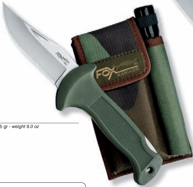
1576 peso 255 gr - weight 9.0 oz