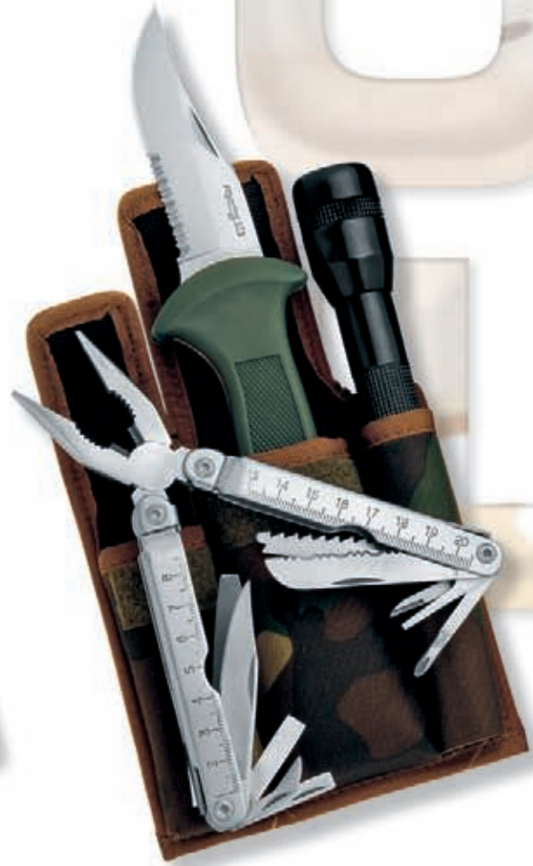
2576/1 peso 450 gr - weight 15.9 oz