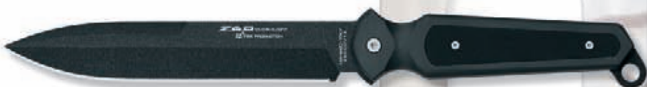
466 G10 peso 250 gr - weight 8.8 oz